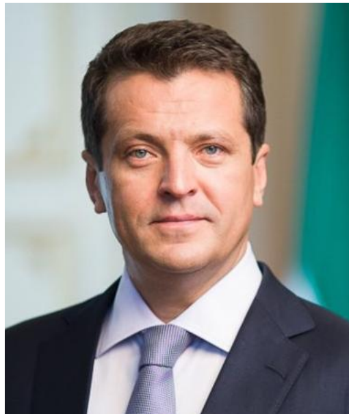
Ильсур Метшин мэр города Казани

«Конкурс позволит журналистам обменяться опытом и передовыми практиками, послужит стимулом для выхода на новый уровень качества информационного продукта и финансового просвещения граждан».