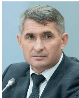
Олег Николаев Глава Чувашской Республики