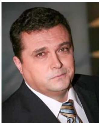
Владимир Соловьёв председатель Союза журналистов России