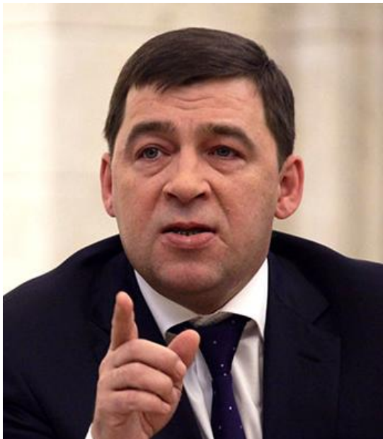
Евгений Куйвашёв губернатор Свердловской области

«Конкурс позволит журналистам обменяться опытом и передовыми практиками, послужит стимулом для выхода на новый уровень качества информационного продукта и финансового просвещения граждан».