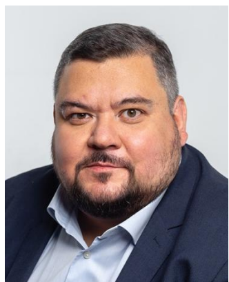
Владислав Кочетков председатель правления, президент холдинга «ФИНАМ»