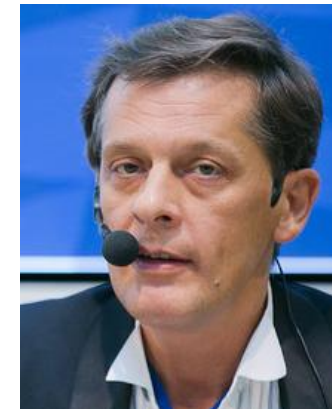
Ян Арт эксперт комитета Госдумы по финансовому рынку