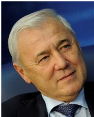
Анатолий Аксаков председатель комитета Госдумы по финансовому рынку