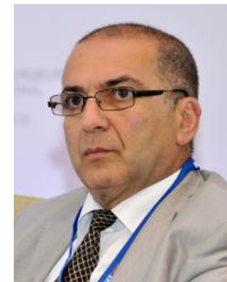
Гарегин Тосунян президент Ассоциации русских банков