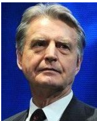
Павел Медведев финансовый омбудсмен