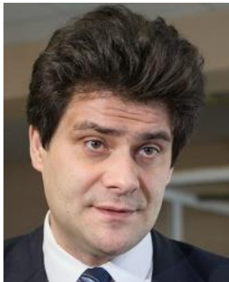
Александр Высокинский мэр г. Екатеринбурга