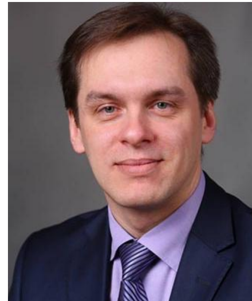
Сергей Кучин министр информационных технологий, связи и средств массовой информации Нижегородской области в 2016 году

«Безусловно, участие в таких проектах как региональный конкурс финансовой журналистики «Рублёвая зона» стимулирует к еще большей вовлеченности в экономику Татарстана и России в целом».