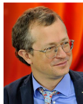
Алексей Саватюгин аудитор Счетной палаты России