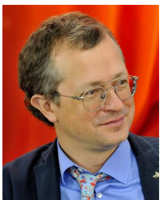
Алексей Саватюгин аудитор Счетной палаты России