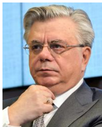
Александр Мурычев вице-президент РСПП, председатель СПКФР